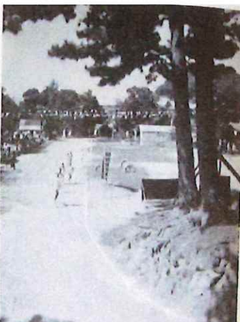
昭和45年校庭整地前の 運動会と二本松