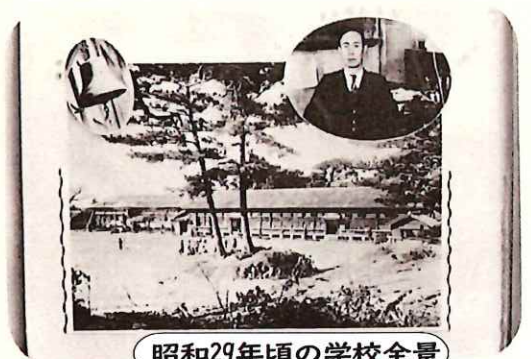
昭和29年頃の学校全景