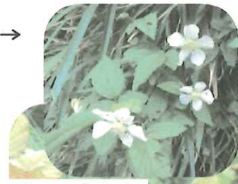
キイチゴ (和名 モミジイチゴ)