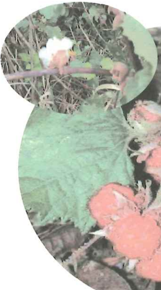
←四月は花卉がまだ白い→

入学式・始業式が終わって教室が変わり、担任の先生とも慣れてきた5月。田んぼに植えられた稲が根をしっかりと張るようになると、農家はほっと一息をつく。海辺では、暖かい空気に潮の香がまじっている。 この時期、野山や岩場に足を踏み入ると子どもたちの楽しみがあちこちに…。