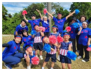
1・2年生「ヤングマン」