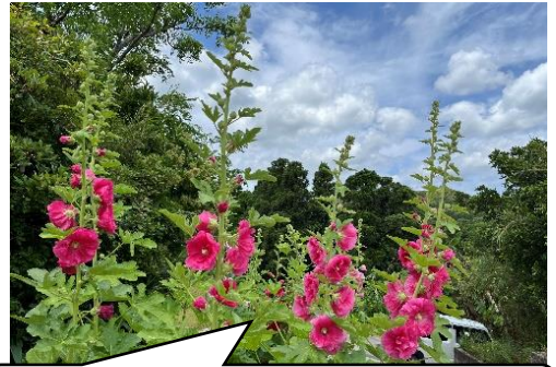
通用門横の『タチアオイ』

新年度が始まり約2か月が経ちました。今のところ、大きな事故等もなく、子供たちは元気に過ごしていて、「〇〇さん、おはようございます。」という相手の名前を入れた挨拶や朝のラジオ体操朝の会の歌声等、大人の私たちが子供たちから元気パワーをもらっている日々です。そんな中、地域の方から、季節を感じる事ができる梅の提供があり、早速クラブ活動の一環で使わせていただきました。